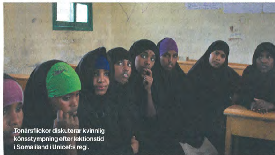
Tonårsflickor diskuterar kvinnlig könstymning efter lektionstid i Somaliland i Unicef:s regi.